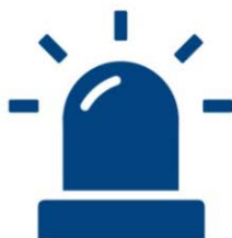
1. Operationele betrokkenheid