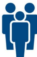
5. Maatschappelijke bijdrage