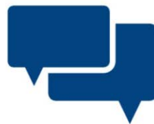
3. Doelgerichte interactie