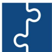
4. Bewust gedrag