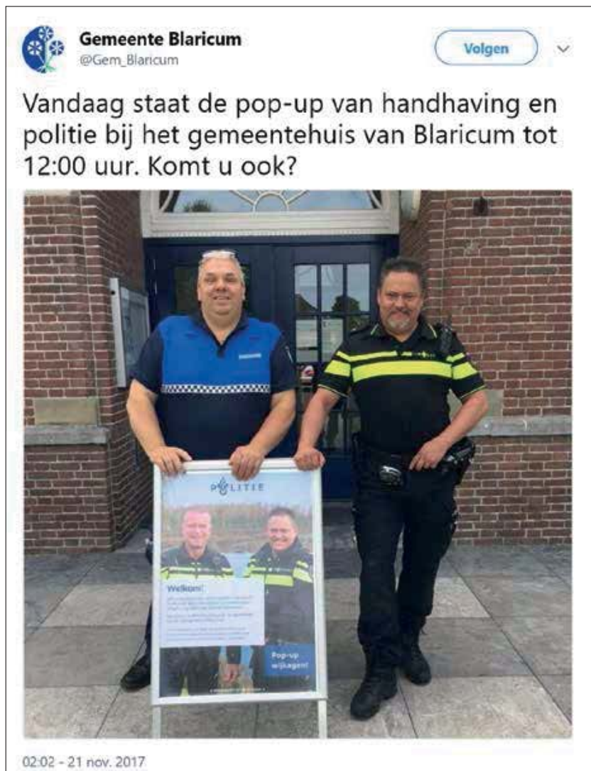
Er zijn inmiddels tientallen gemeenten in Nederland met een mobiele wijktafel of Pop-uppolitiebureau die online en offline contact tot stand brengen.

Emoties worden steeds vaker via sociale media gedeeld, waardoor een vonk kan overslaan op anderen (Kramer, Guillory & Hancock, 2014; De Vries et al., 2018). Zo werden heftige emoties losgemaakt door de opsporingsvideo van de 'kopschoppers Eindhoven'. Hoewel de daders dankzij de hulp van een grote groep burgers in één dag werden opgespoord, kregen zij strafvermindering omdat hun privacy was geschaad. Hoewel de burgers waarschijnlijk in actie kwamen door de verspreide beelden, laat dit voorbeeld dus ook zien dat politie en Openbaar Ministerie in het contact met burgers een goede balans moeten zoeken tussen informatiewaarde en de rol van emoties. Inspeelen op emoties vereist een andere manier van communiceren dan alleen maar informeren en is ook lastiger omdat emoties niet overeen hoeven te komen met wat er feitelijk gaande is.