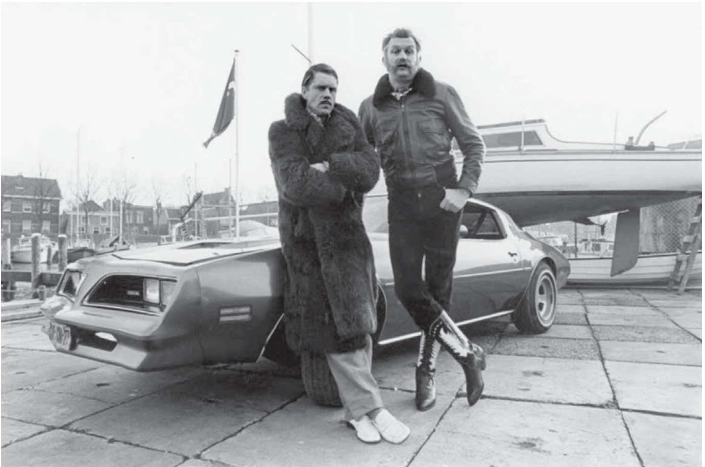
Wat doet je beslissen iemand staande te houden: a) persoonskenmerken, b) de omstandigheden van de situatie en het gedrag, c) kenmerken van een voertuig.

den- en Oost-Europa die volgens het SCP juist weer minder dan niet-westerse groepen het gevoel hebben onderwerp te zijn van etnisch profileren door de politie.