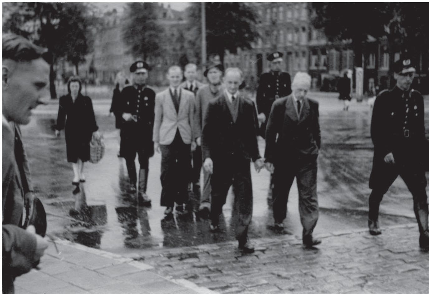
Razzia Amsterdam-Oost, 20 juni 1943.