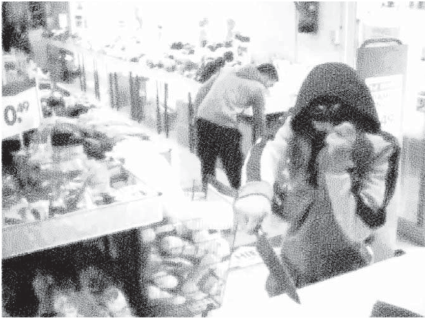
Figuur 2.3: Voorbeeld van bedreigen met scherp voorwerp