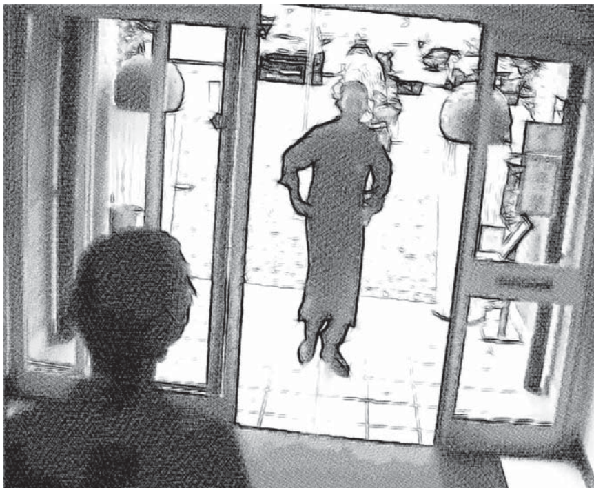
Figuur 2.2: Voorbeeld van handen in de zij