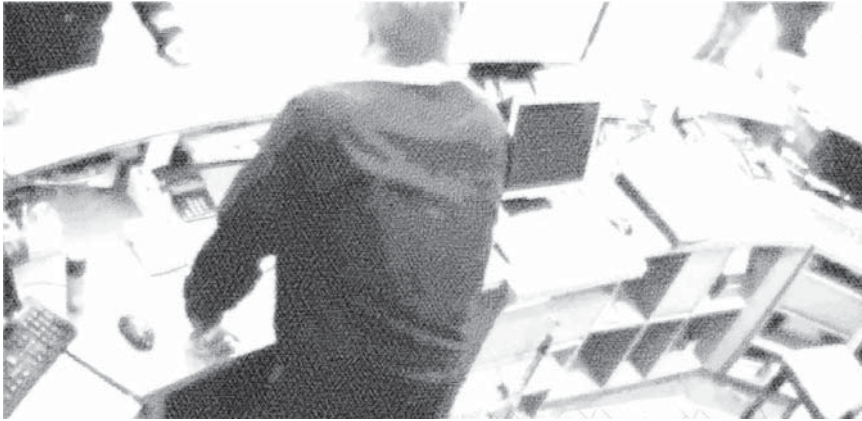
Figuur 2.1: Voorbeeld van een expansieve houding