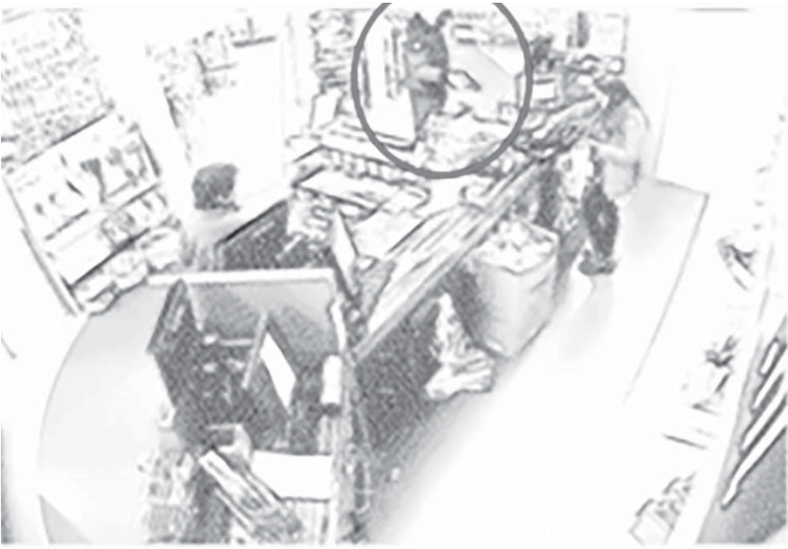
Figuur 2.4: Voorbeeld van bedreigen met vuurwapen