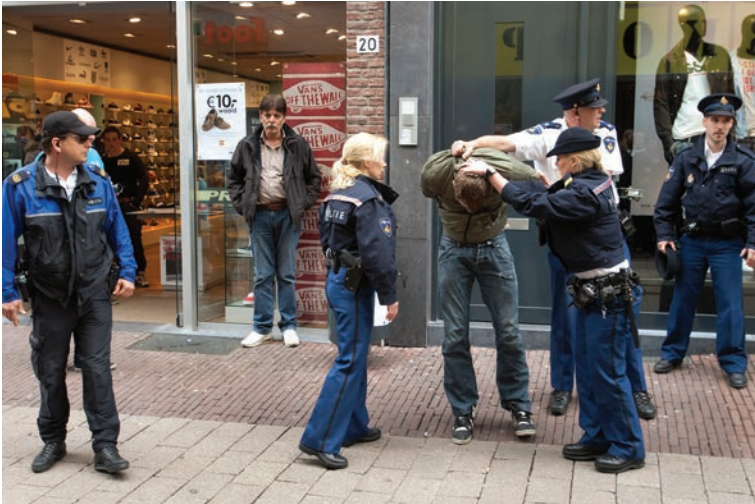
De regiopolitie Gelderland-Midden oefent in de Arnhemse binnenstad (7 april 2011).