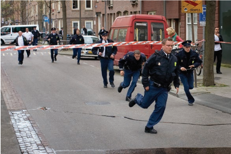
In de Amsterdamse Westerparkbuurt komen ongeveer tien dienders aangerend om collega-agenten te assisteren die bij de arrestatie van twee Marokkaanse jongemannen op collectief verzet stuiten (11 april 2007).