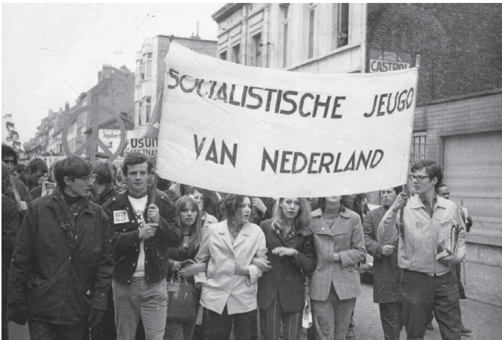
Demonstratie van de Socialistische Jeugd.