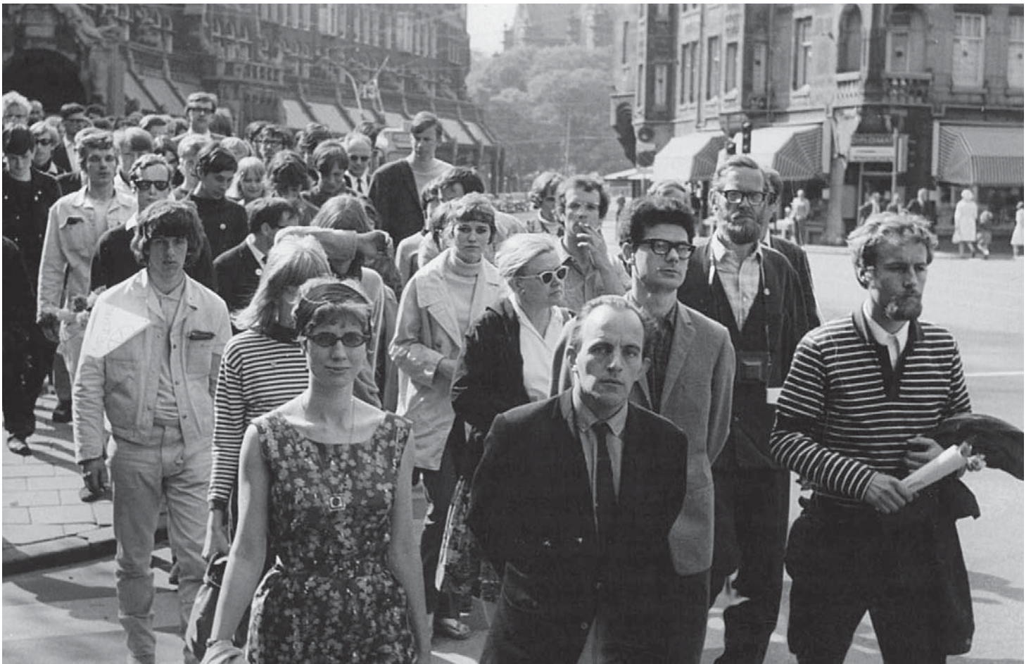
Demonstratie tegen de Vietnamoorlog.

Tijdens de roerige jaren zestig infiltrerden Amsterdamse agenten in links-radicalen groepen. Pas na 45 jaar is hun intrigerende verhaal opgetekend in het boek 'De groep IJzerman'.